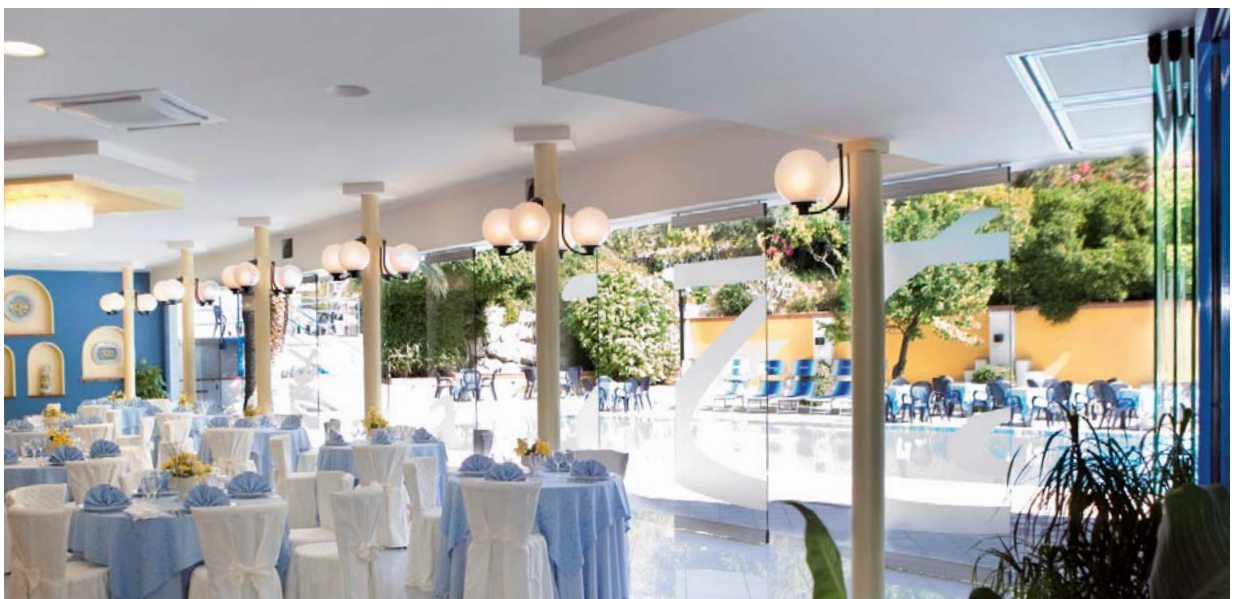
Hotel la Tonnara, Amantea, Cosenza