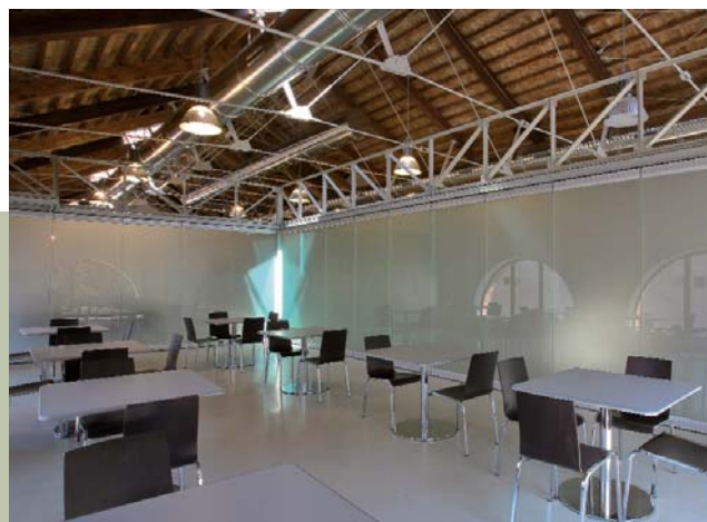
Sala mensa dell'Arsenale di Venezia Canteen of the Arsenale di Venezia

Movable crystal glass partitions composed of single sheets of tempered glass, slide along overhead guides to provide optimal solutions where it is necessary to physically separate internal or external spaces for a more versatile solution, while maintaining visual continuity.