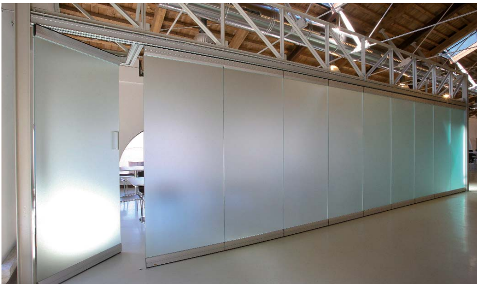
Cantiere di riferimento: Recupero ed adeguamento funzionale dell'edificio 96, 96a, 96b, 96c nell'area dei bacini di carenaggio presso l'area Nord dell'Arsenale di Venezia. Cantiere del Consorzio Venezia Nuova concessionario del Ministero delle Infrastrutture e dei Trasporti - Magistrato alle Acque di Venezia.